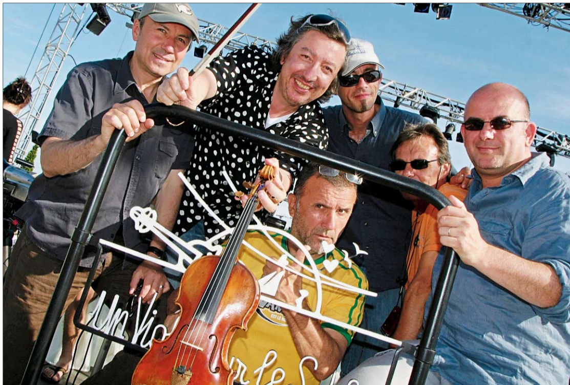
Les artisans du Violon ont chacun dans un coin de la tête un projet en forme de rêve.